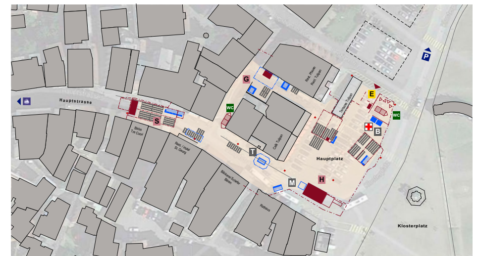
Lageplan Einsiedler Musikfest